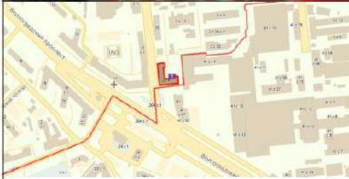
Рис.1 Фасад здания, схема расположения земельного участка